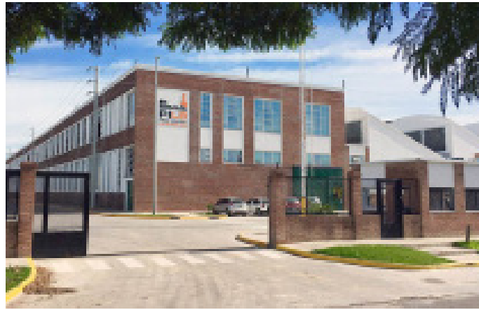
Parque Industrial La Bernalesa

las últimas décadas se permitió la toma de tierras, especialmente sobre Italia ente Otamendi hacia el Norte. Hoy hay un barrio precario en tierras que debieron ser utilizadas como recreación, especialmente para quienes no pueden irse de vacaciones.