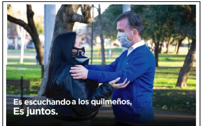
Diego Santilli DIPUTADO

(Confederación Argentina de Medianas empresas)