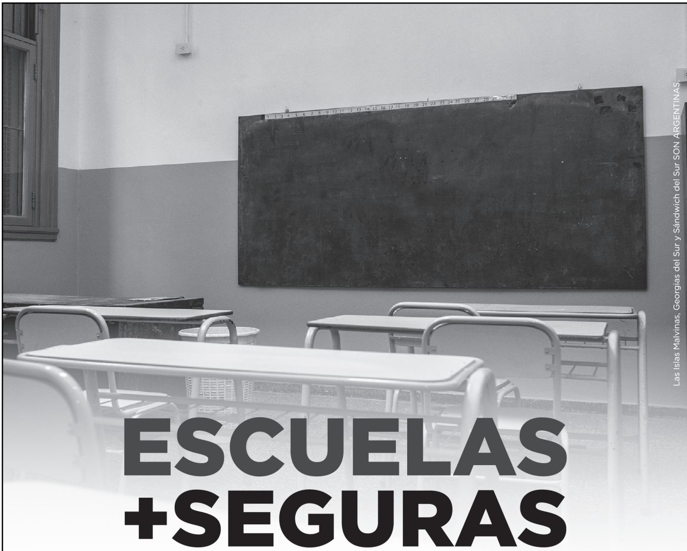
Las Islas Malvinas, Georgias del Sur y Sándwich del Sur SON ARGENTINAS.

“Es una mejora integral para poder tener mejores con-