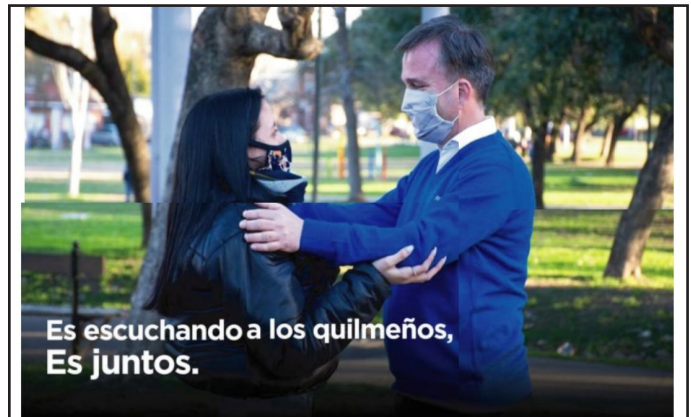
Diego Santilli DIPUTADO

Además, tiene un equipo de salud de Atención Primaria, de lunes a viernes de 8 a 17, y dentro de su personal se encuentran una auxiliar de farmacia, una promotora de salud, enfermeros, médicos clínicos, un médico ginecólogo, dos licenciadas en obstetricia, una licenciada en psicología, un licenciado en nutrición, dos odontólogas y un trabajador social.