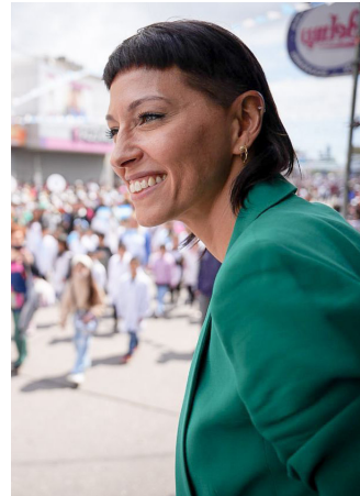
a trabajar, trabajar y trabajar".