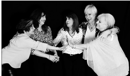
Mejor Malas Conocidas

"DISFUNCIONALES": Sábados 16 y 23 - 20.30 / Domingos 17 y 24 - 19.30 hs.