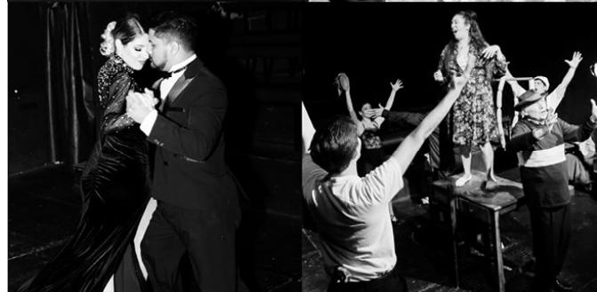
Los Miserables Tango. Una obra imperdible