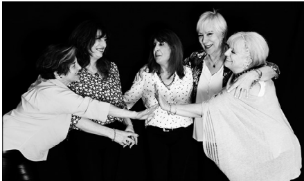
Mejor Malas Conocidas

"DISFUNCIONALES": Sábados 16 y 23 - 20.30 / Domingos 17 y 24 - 19.30 hs.