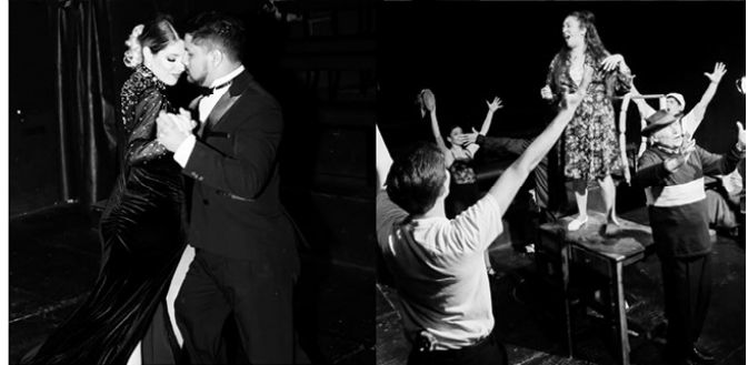
Los Miserables Tango. Una obra imperdible