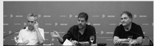
GOBIERNO DE LA PROVINCIA DE BUENOS AIRES

"Se pueden sentar, se pueden juntar en vez de seguir dando vueltas haciendo convocatorias que no se entienden para qué las hacen. Que se junten y que definan", reiteró.