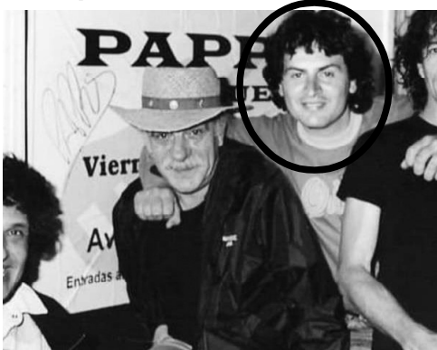
Gabriel García era además el fotógrafo de Vox Dei